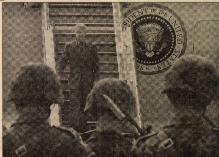
Az amerikai elnök a varsói repülőtéren