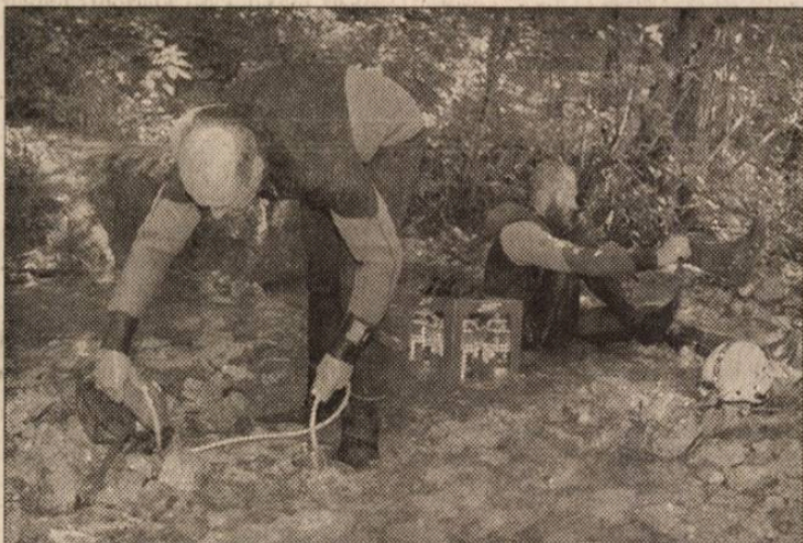
A kutatás az eltűnt társ után lapzártánkör még mindig nem ért véget...

A negyvenöt perc nem olyan feszült várakozással telik, mint gondolnánk. Összesen két marok-