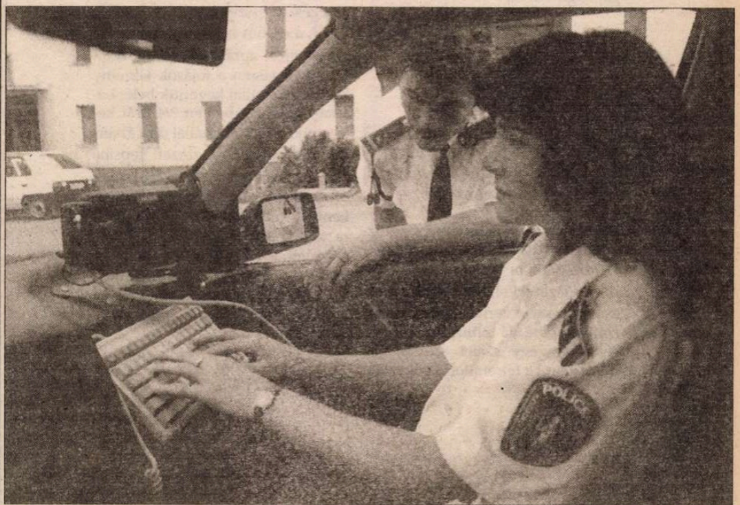
Két darab Falcon típusú rendszám-azonosító berendezést kapott ajándékba a Hungária Biztosítótól a Nógrád Megyei Rendőr-főkapitányság

Exkluzív utak csoportoknak: Mexikó-Kuba, Kalifornia-Mexikó, Dél- és Közép-Amerika, Közékelet, Malajzia-Indonézia. Néhány ajánlatunk a Képvásár 408. oldalán. HÍVJON, JÖJÖN: 169-4027, REK-KER Kft., 1042 Bp., István út 17-19.