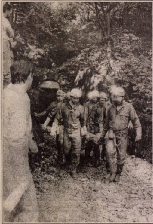
A barlangi mentők és a búvárok már pénteken délután megtalálták a szerencsétlenül járt fiatalember holttestét a Kossuth-barlangban, felszínre hozni azonban csak tegnap este tudták.