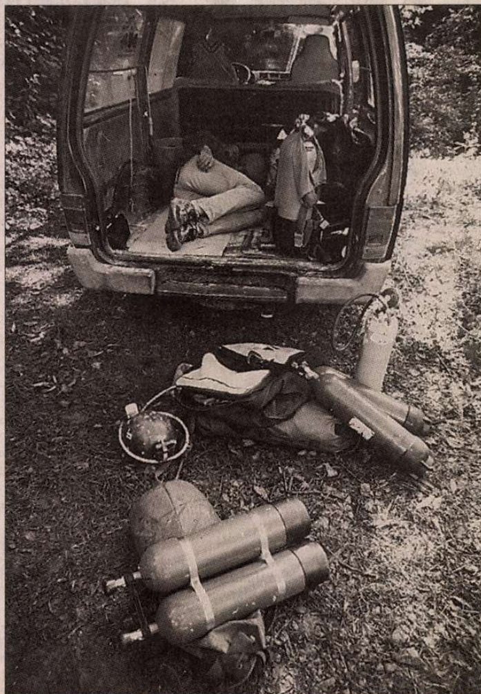
Ennek a mentőnek szerencséje volt, a többiek már csak a földre dőlhettek le pihenni