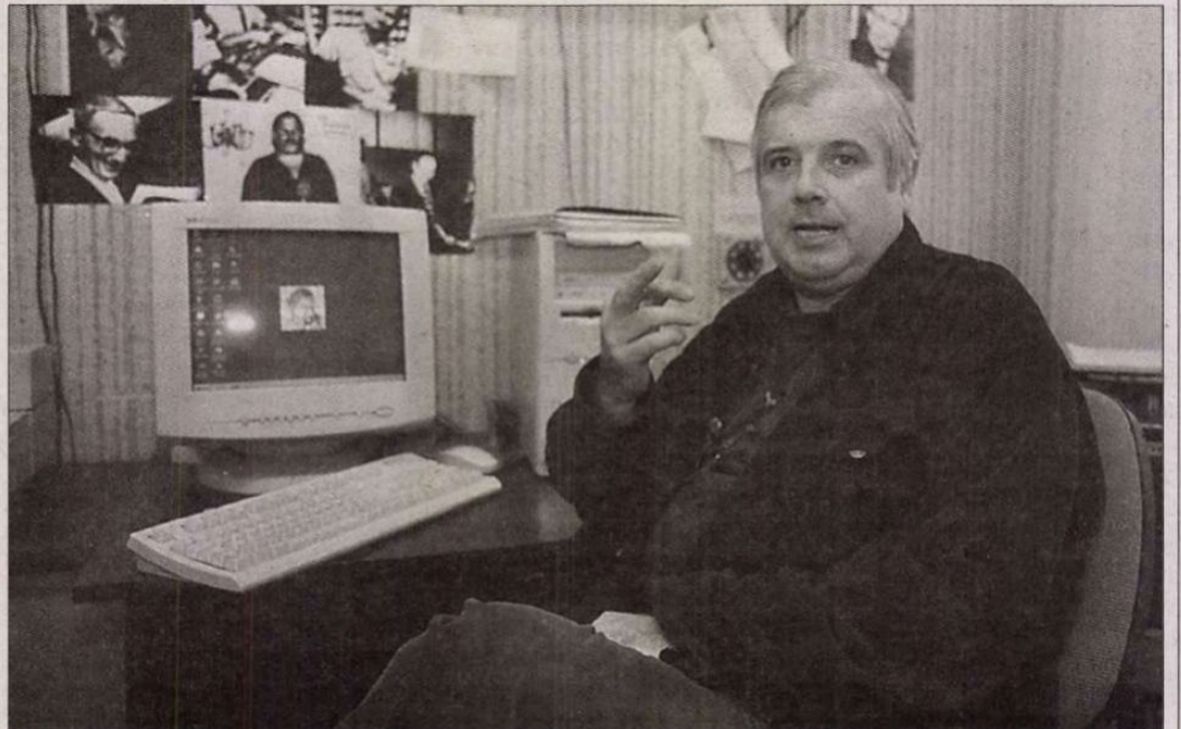
„Vannak olyan munkatársaim, akikkel a világon semmiben nem értünk egyet”

– Furcsa dolog, hogy vannak olyan munkatársaim, akikkel a világon semmiben nem értünk egyet. A hétköznapi kapcsolatomban mégis jó velük, tündéri, aranyos emberek. Aztán amikor elolvasok vagy látok hallok tőlük valamit, úgy érzem, mintha nem is azok lennének, akikkel a rádió folyosóján beszélgetni